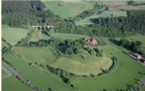
Luftaufnahme des Schützebergs. Foto: P. Becker 2010

Der Eco Pfad Kulturgeschichte Wolfhagen ermöglicht eine Zeitreise durch die Umgebung der ältesten Stadt im Landkreis Kassel – Wolfhagen entstand um 1226. Der Eco Pfad führt zum ehemaligen Standort des rituellen Tauchbads der jüdischen Gemeinde, zu den Spuren eines mittelalterlichen Dorfes, das erstmals 1015 erwähnt wurde, zum Wasserschloss Elmarshausen und zum Schützeberg, auf dem die älteste Kirche im Wolfhager Land stand. Weitere Stationen sind die Schützeberger Mühle, die „Kolonien“ sowie die Vertriebenengedenkstätte am Ofenberg.